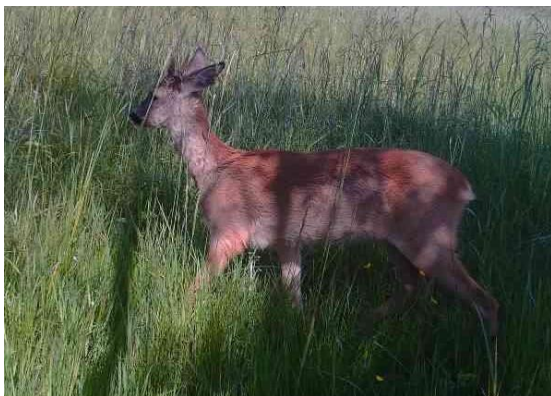
Ung bock med klen hals.

Många skjutet bara bockar och då helst 6:or. Det är dock inget tecken på att det är en kapitalbock, den kan vara två år gammal lika väl som fem. Av våra hjortdjur är rådjuret det svåraste att bedöma ålder på. Vad som förändras utseendemässigt är att hornens grovlek ökar, rosenstocken blir större samt att huvudet och halsen blir grövre och kroppen tyngre. Just halsens grovlek och kroppens tyngd är det bästa sättet att avgöra en bocks ungefärliga ålder. Det enda säkra sättet att åldersbestämma är via tänderna.