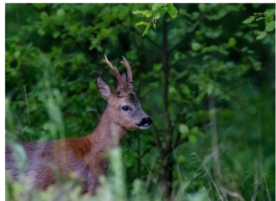
En äldre herre.

Rådjur är otroligt anpassningsbara och, om inte räven eller slättermaskinen är framme, väldigt produktiva. Tvillingfödsel tillhör vanligheter, så även trillingar däremot är fyrtingar sällsynta. Kiden spenderar större delen av dagen i lega där de ligger helt orörliga, och på så sätt inte avger någon vittring över huvud taget. Har geten flera kid använder hon sig av flera legor, inte sällan 50 meter eller mer mellan legorna för att undvika att räv eller andra rovdjur tar alla kiden för henne.